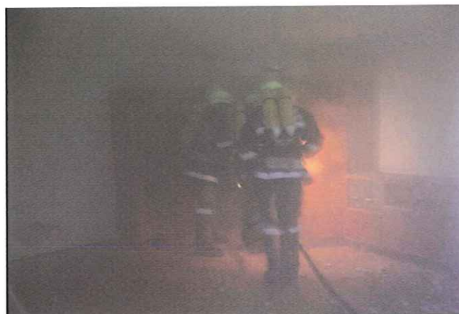
Personensuche bei einer Atemschutzübung

Es wurden hierfür insgesamt 3487 Stunden geleistet.